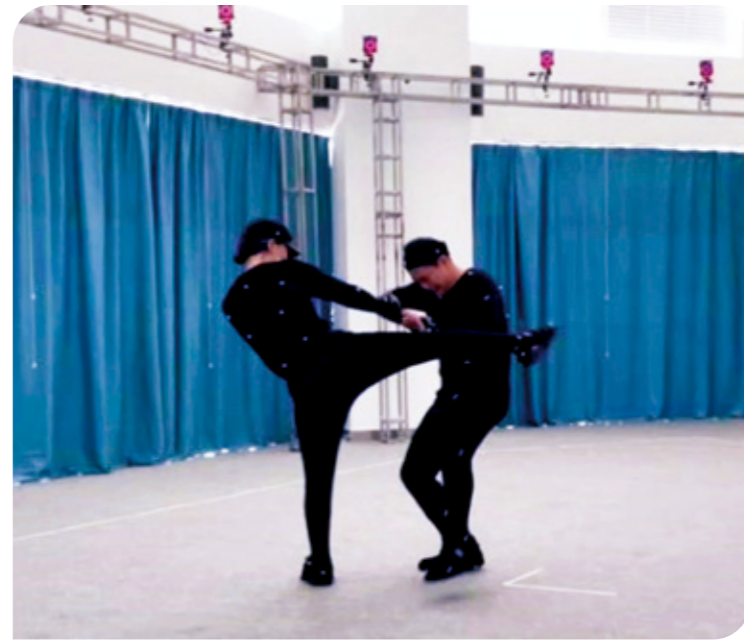
双人武打动作捕捉