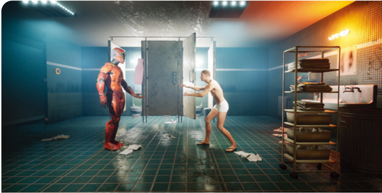
琥汉导演实时动作捕捉戏剧《脑死亡自助餐》