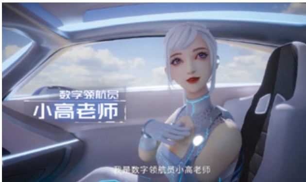
数字领航员小高老师